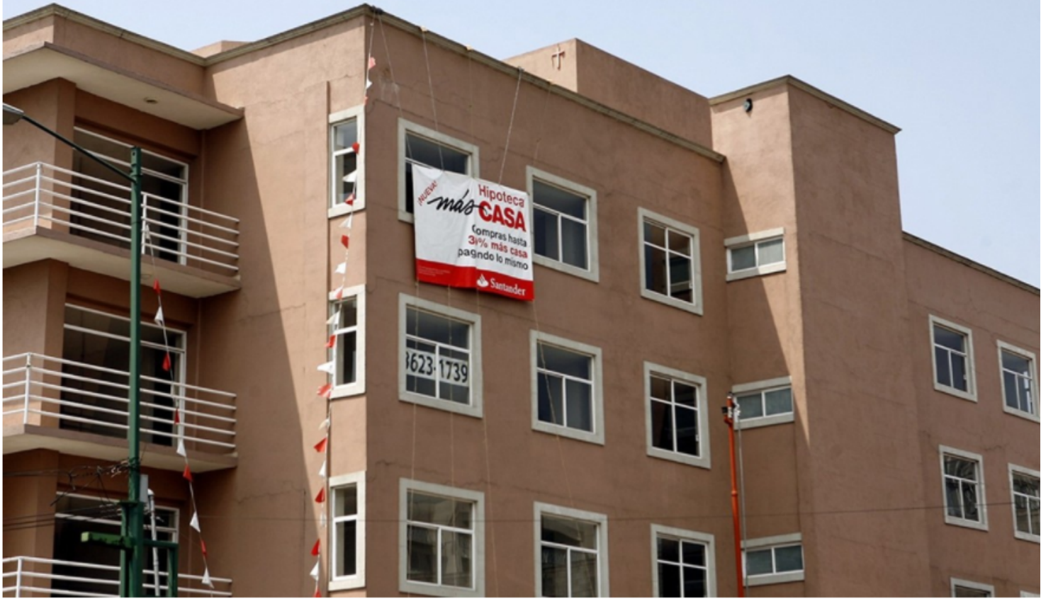
Comprar casa en una zona de plusvalía creciente, puede aumentar la ganancia de tu inversión.

Por Miguel Olivera - 11 de Abril de 2021